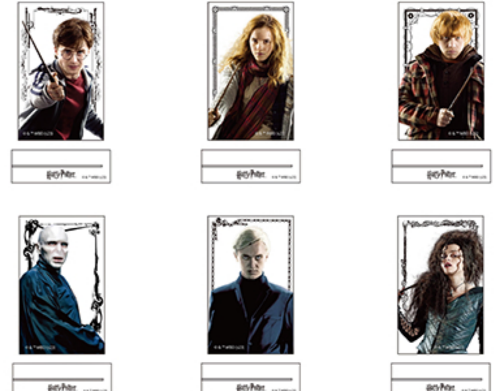
WIZARDING WORLD characters, names and related indicia are © & ™ Warner Bros. Entertainment Inc. WB SHIELD® & ™ WSEI Publishing Rights - JKR. (s23)