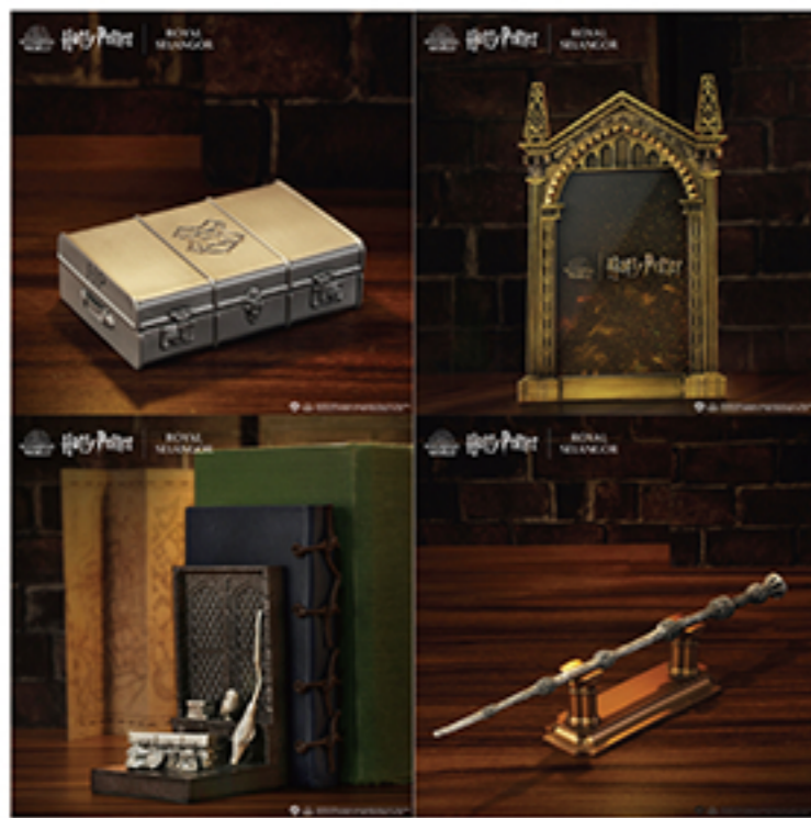
WIZARDING WORLD characters, names and related indicia are © & ™ Warner Bros. Entertainment Inc. WB SHIELD® & ™ WSEI Publishing Rights - JKR. (s23)