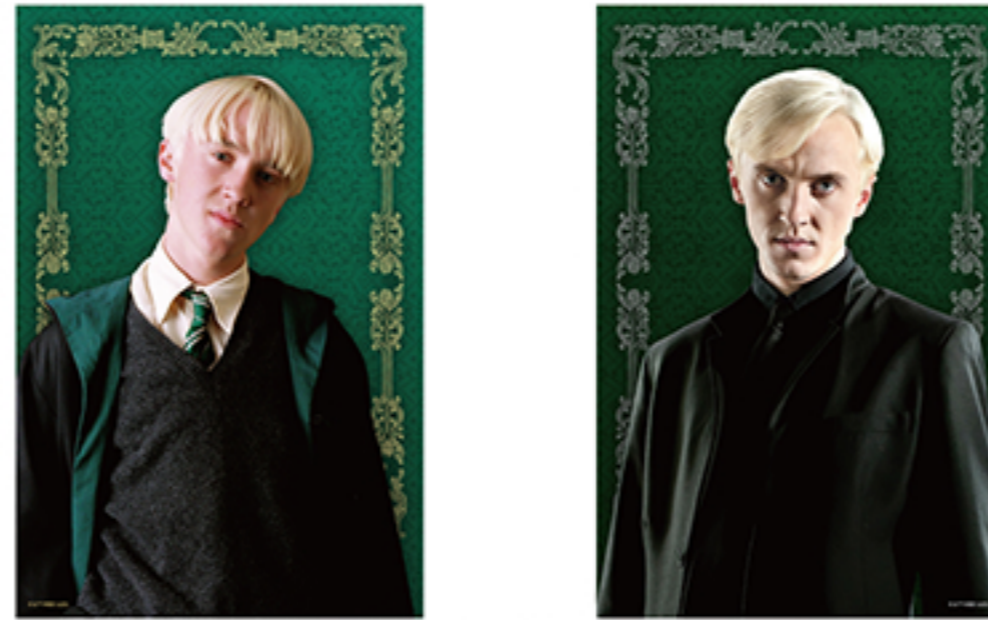
WIZARDING WORLD characters, names and related indicia are © & ™ Warner Bros. Entertainment Inc. WB SHIELD® & ™ WSEI Publishing Rights - JKR. (s23)