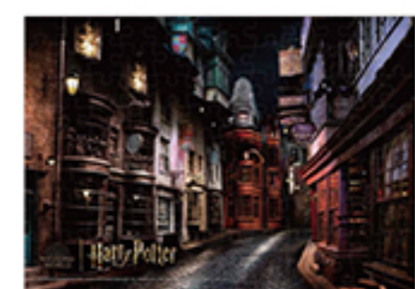
WIZARDING WORLD characters, names and related indicia are © & ™ Warner Bros. Entertainment Inc. WB SHIELD® & ™ WSEI Publishing Rights - JKR. (s23)