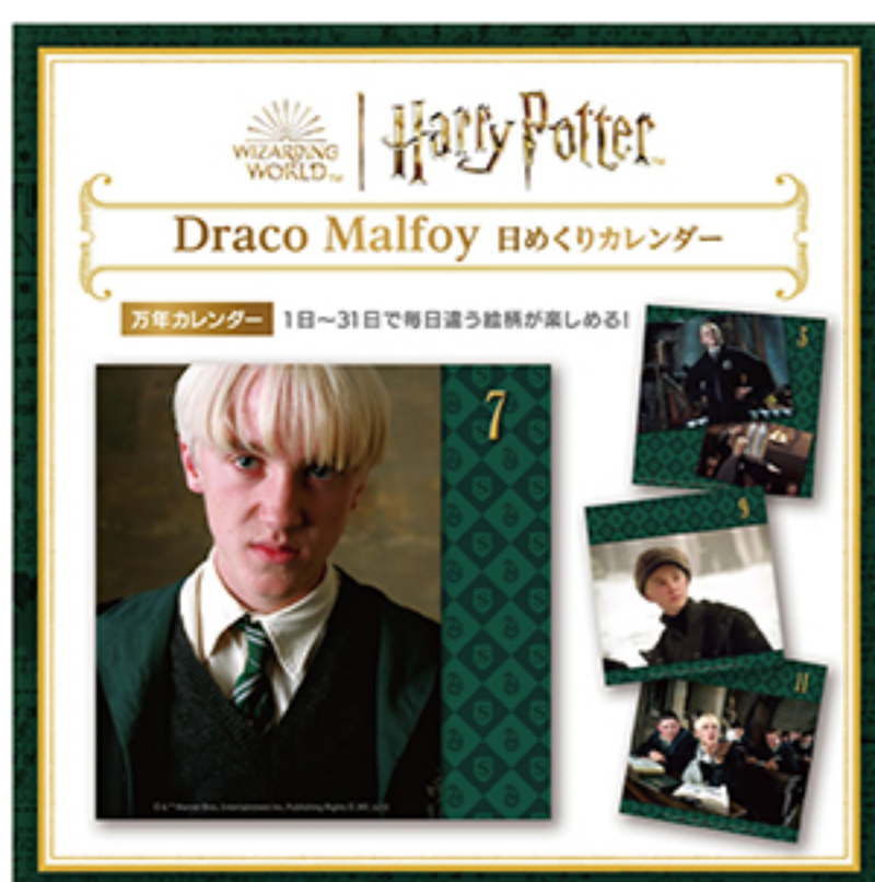
WIZARDING WORLD characters, names and related indicia are © & ™ Warner Bros. Entertainment Inc. WB SHIELD® & ™ WSEI Publishing Rights - JKR. (s23)